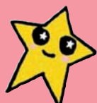
ねがいボシ 「かなえっち」